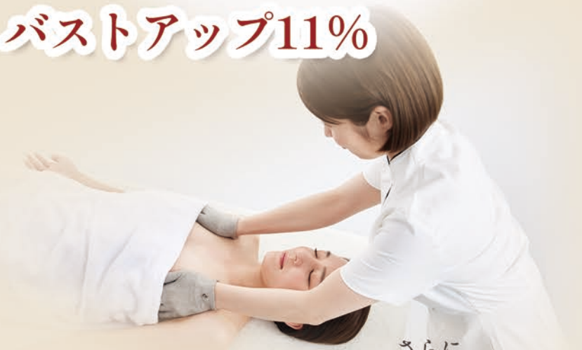
※バストアップメニューを導入しているサロン割合 (リクルート調べ)

さらに バストのお悩みを改善するには 豊胸手術しかない 勘違いしている女性が 8割以上という悲しい結果に・・・